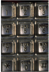
Légende accompagnant l'illustration.

Les informations les plus importantes se trouvent ici, à l'intérieur de la brochure. Présentez votre organisation ainsi que les produits ou services spécifiques qu'elle propose. Ce texte doit être court, et donner envie au lecteur d'en savoir plus.