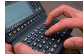
Légende accompagnant l'illustration.

bortis nisl ut aliquip ex en commodo consequat. Duis te feugifacilisi per suscipit lobortis nisl ut aliquip ex en commodo consequat.