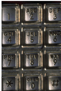
Légende accompagnant l'illustration.

Les informations les plus importantes se trouvent ici, à l'intérieur de la brochure. Présentez votre organisation ainsi que les produits ou services spécifiques qu'elle propose. Ce texte doit être court,